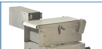
推桿 (適用於厚裝商品)