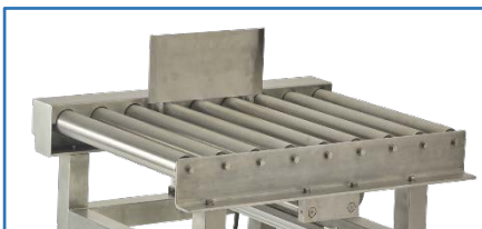
滾筒推桿 (適用於箱型商品)