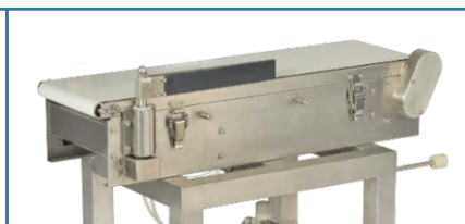
單擺 (適用於盒,罐裝商品)