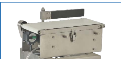
單擺 (適用於盒,罐裝商品)