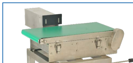
推桿 (適用於箱型商品)