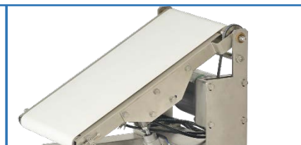
墜落 (適用於薄型商品)